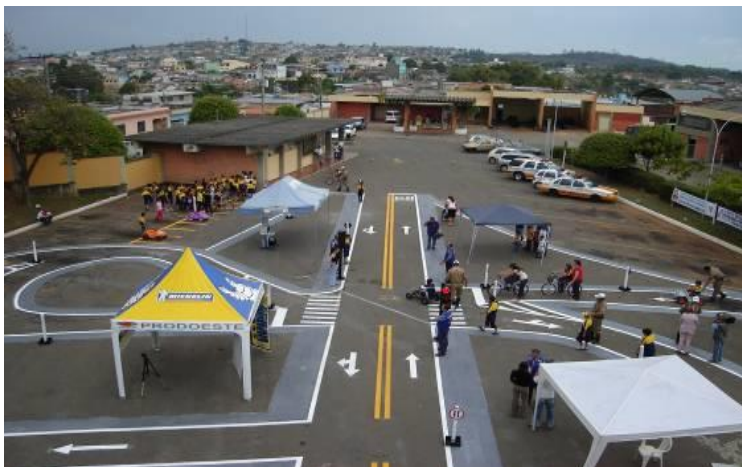
FIGURAS 6 – Pista de educação de trânsito no DER-MG de Formiga

Abaixo, algumas fotos feitas quando das ações educativas realizadas naquele espaço por agentes dos DER-MG e da Polícia Rodoviária Estadual: